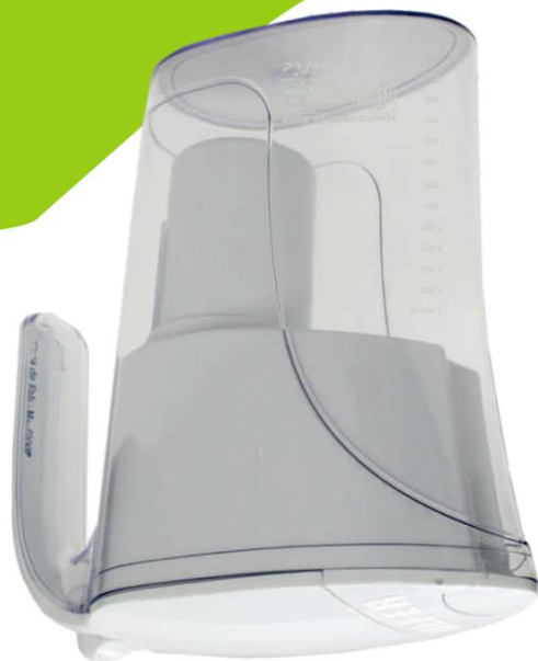
6 etapas de Filtraje